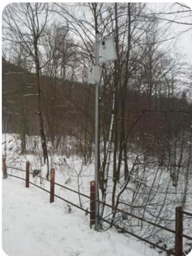
AMM - Hladinoměř